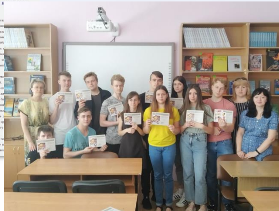
Дипломанти Всеукраїнського конкурсу з англійської мови «Олімпус»