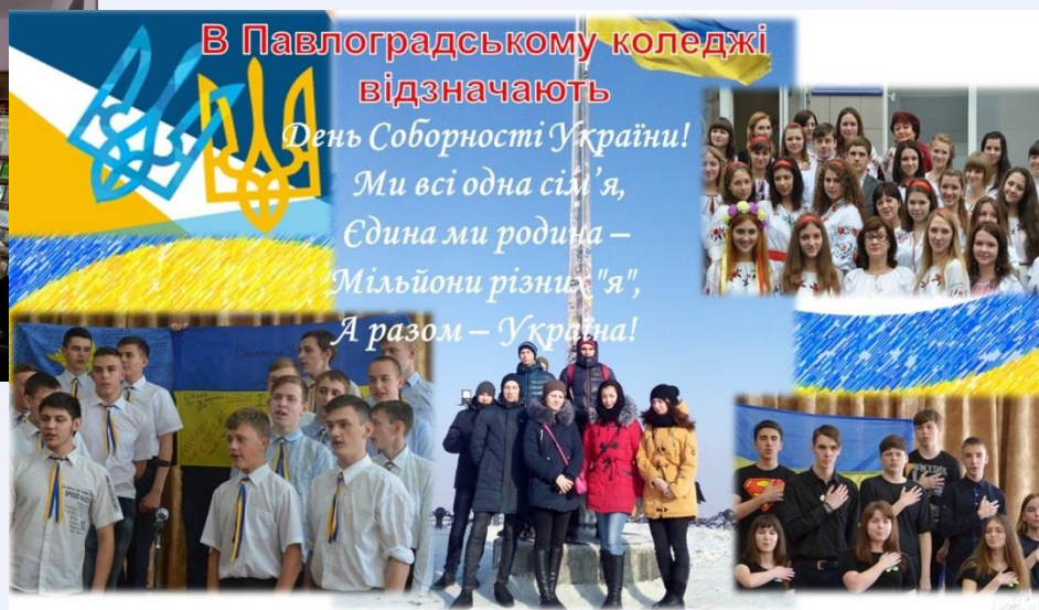
День Соборності України