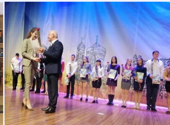
Нагородження кращих студентів коледжу стипендією міського голови