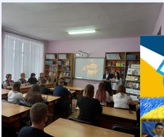
Всесвітній день поезії